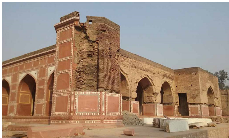
تصویر ۶. مقبره نور جهان در لاهور