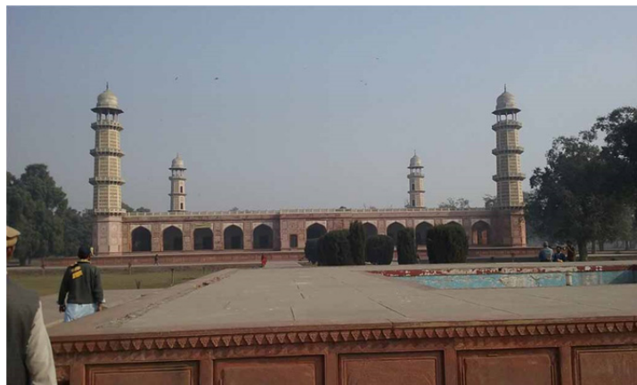
تصویر ۴. آرامگاه جهانگیر در لاهور

هر چه تمام تر در لابه لای آن کار گذاشته شده اند (دیلیس، هاتشتاین، ۱۳۹۰: ۴۷۹). در این بنا می توان اولین جرقه تغییرات در فرم و ظاهر سازه های آرامگاهی در هند را مشاهده نمود.