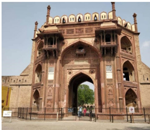
تصویر ۷. ورودی نور محل سرای در پنجاب