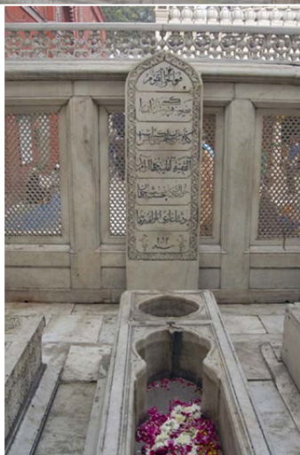
تصویر ۸ مقبره جهان آرایبگم، دهلی

http://www.ignca.gov.in/asp/showbig.aspprojid