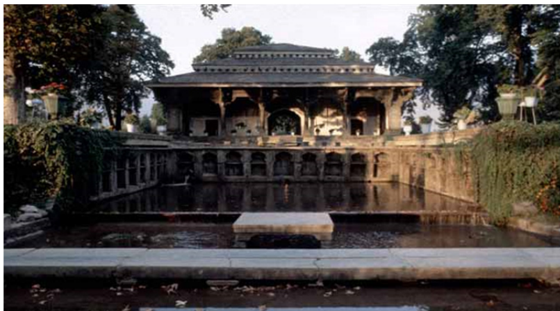
تصویر ۲. باغ شالیمار،

https://digital.library.cornell.edu/catalog/ss