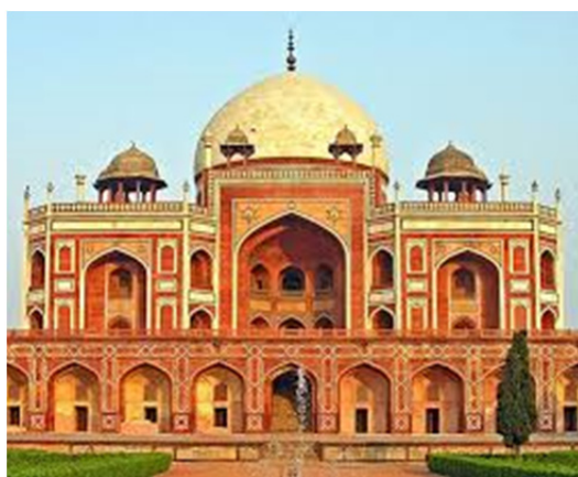
تصویر ۱. آرامگاه همایون در دهلی.

ایرانی می باشد می توان به وضوح مشاهده نمود. این آرامگاه در زمان اکبر بین سالهای (۹۷۰ - ۹۷۸ ه.ق) در دهلی در مرکز یک چهارباغ به وسیله معماری ایرانی به نام میرک میرزا غیاث و پسرش سید محمد ساخته شد. نام همسر ایرانی همایون به خاطر تقبل هزینه های ساخت و ساز، در ارتباط با این مقبره مطرح است (ابا کخ، ۱۳۷۳: ۴۴). آرامگاه در میان باغی به سبک چهارباغ ایرانی روی صفا ای با ۷۲ حجره برای اسکان مسافران خسته بنا شده است. بنا دارای ۲۴ مناره باریک در دو طرف پیش طاق ها و زوایای هشت گوش است و کتیبه های قرآنی به زیبایی آراسته شده است. آرامگاه همایون در واقع نخستین نوع از سلسله عمارت های باشکوهی است که در دوره گورکانیان با الهام از معماری ایرانی - اسلامی ساخته شده است. علاوه بر ساخت آرامگاه همسرش او باغ زیبا و فرح بخشی و خانه ای اشرافی در جاده ای آگرا به بانایا ساخت (Mishra, 1967: 92). تاثیر این بنای با سبک ایرانی از این پس در طی سه قرن در تمام بناهای دوره ی گورکانیان هند به چشم می خورد (شاطری، ۱۳۹۳: ۶۳۵). یکی دیگر از تاثیرات این ساختمان بر بناهای دیگر در هند به کار گیری طاق های خراسانی ۳ در معبد گویند دوا در ورینداوان از معابد هندو است. ۴ این مقبره اولین ذوق هنری بانوان ایرانی در ورود به عرصه معماری عصر گورکانیان است.