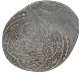
سکه علی موید، محل ضرب نامشخص، تاریخ ضرب ۷۸۰ هجری قمری، منبع: موزه ملی ملک، شماره اموال: ۳۰۰۰۰۰۶۰۰۱۱۰

۳۱۰ پژوهش‌نامه تاریخ اجتماعی و اقتصادی، سال ۱۱، شماره ۱، بهار و تابستان ۱۴۰۱