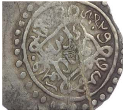
سکه علی موید، سال ۱۷۷۵ ه.ق، ضرب سمنان