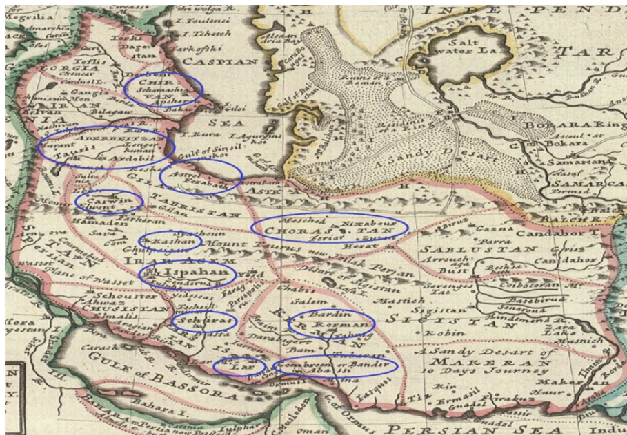
نقشه شماره ۱ - پراکنده مکانی زلزله‌های ایران در دوره صفویه