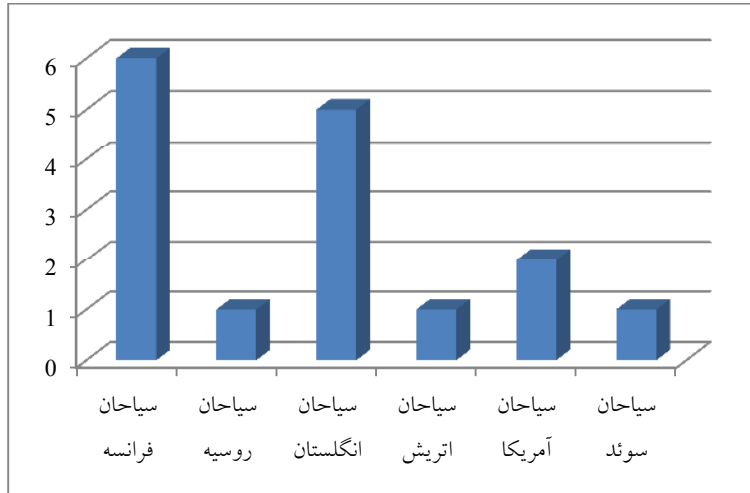
نمودار ۱. ارزیابی حضور سیاحان اروپایی در دوران قاجار بر مبنای ملیت آنان