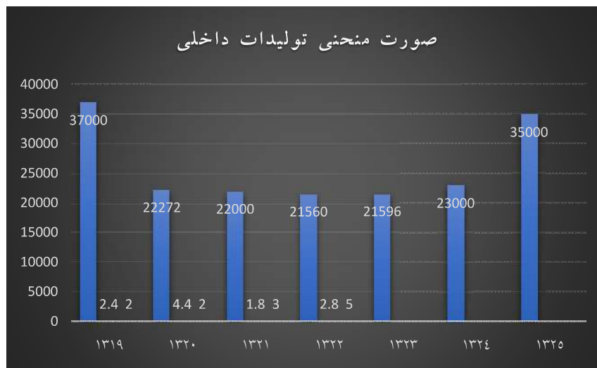
نمودار ۲. صورت منحنی تولیدات داخلی

همانطور که در جدول ۱ و نمودار ۲ مشاهده می شود میزان واردات قند و شکر در سال ۱۳۱۹ نزدیک صد هزار تن می باشد. در سال ۱۳۲۰ با اشغال نظامی و مشکل در واردات