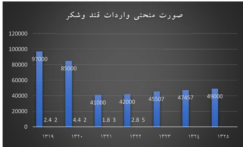
نمودار ۱. صورت منحنی واردات قند و شکر از سال ۱۳۱۹ تا ۱۳۲۵

به شدت کاهش پیدا کرده است . در جدول (شماره ۱) . نمودار ۱ میزان تولید داخلی و واردات قند و شکر از ۱۳۱۹ تا ۱۳۲۵ به طور مقایسه ای آورده شده است .