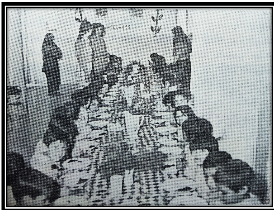
نگهداری اطفال در مهدکودک‌های مراکز رفاه خانواده اصفهان (بولتن هفتگی سازمان زنان ایران، ۱۳۵۵، ش ۴۳۲: ۱).

واکسن فلج برای کودکان جهت پیشگیری از بیماری های واگیردار انجام گرفت (ساکما، ۲۷۵/۱۲۲۴: ۴ ؛ ساکما، ۲۷۵/۱۰۴۶: ۳).